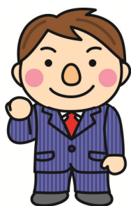
不動産部キャラクター だいちくん