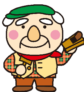
建築部キャラクター ハンスさん